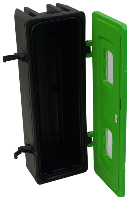
« EU-PORTA-COFFRE » en option

En cas d'impossibilité d'installation d'une douche de sécurité fixe sur un réseau d'eau potable, le « EU-PORTA-DOUCHE » apporte immédiatement et en toute circonstance une « solution d'appoint ».